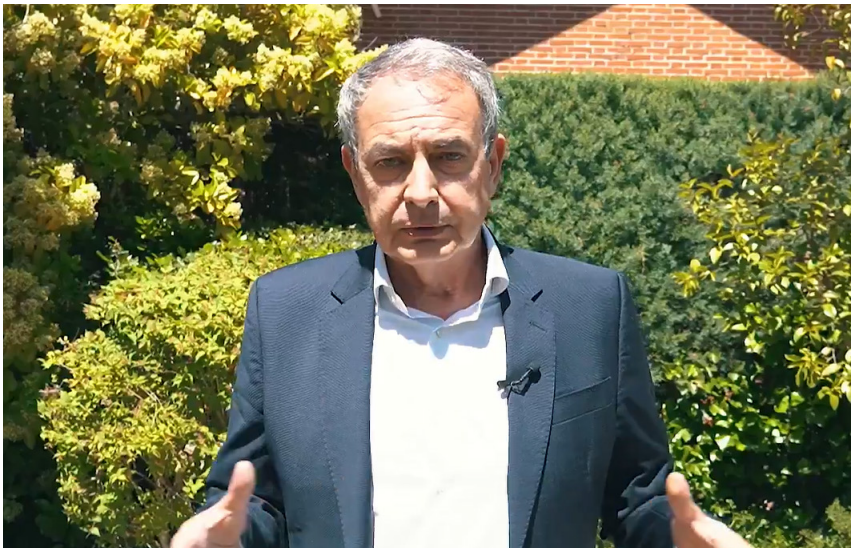
DEFENSA. Rodríguez Zapatero rechazó las acusaciones en un video.