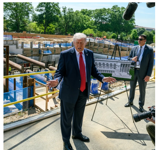
CRÍTICA. Trump ha calificado al régimen cubano de corrupto e incompetente.

A esto se le suma un reporte sobre una supuesta inteligencia confidencial relacionada con posibles planes para atacar puntos estratégicos estadounidenses con drones iraníes y rusos presuntamente adquiridos por el régimen.