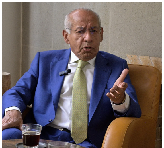
RIESGO. El jurista señala que el gobierno ha sido permisivo con el crimen organizado.

El exprocurador general de la República participó en la serie de Conversaciones para decidir con libertad