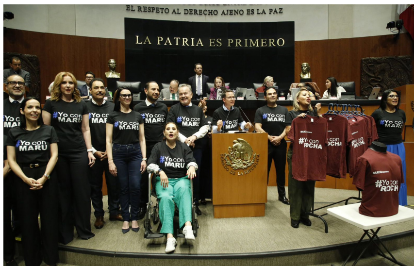
AVAL. Panistas retaron a Morena a usar playera de #YoconRocha.

En la Cámara de Diputados hubo fricciones por unas mantas colgadas en los palcos por la fracción del PRI que decían: "El cartel de los rateros, asesinos, corruptos, criminales narcos del Bienestar", lo que provocó que se abriera un receso para calmar los ánimos.