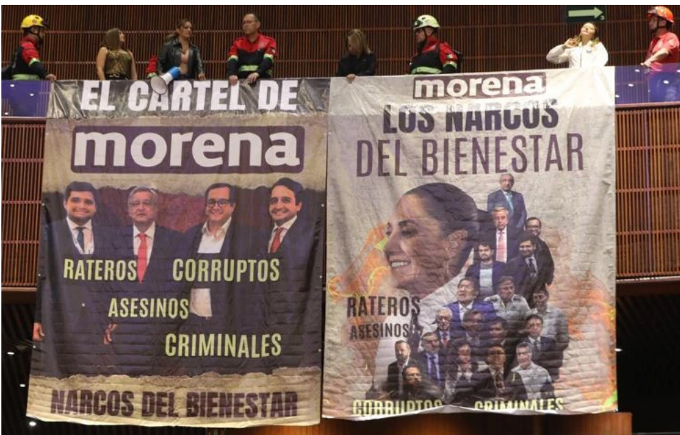
SAN LÁZARO. Manifestación en la sesión de plenos contra políticos de Morena.

La crisis en torno al Estrecho de Ormuz inició una nueva fase marcada por señales de distensión en el tráfico marítimo. Redacción. P15