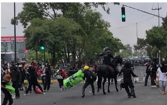
PROTESTAS. Radicales agredieron a la policía en inmediaciones del Estadio.

El costo de la paz mundialista para evitar la confrontación abierta fue transformar el sur de la CDMX en una zona restringida, imponer el home office, suspender clases, ahorracar la movilidad en vías principales, como Tlalpan, y cerrar estaciones del Metro y del Tren Ligero; además de desplegar el uso de 46 mil 835 elementos de seguridad para resguardo del evento.