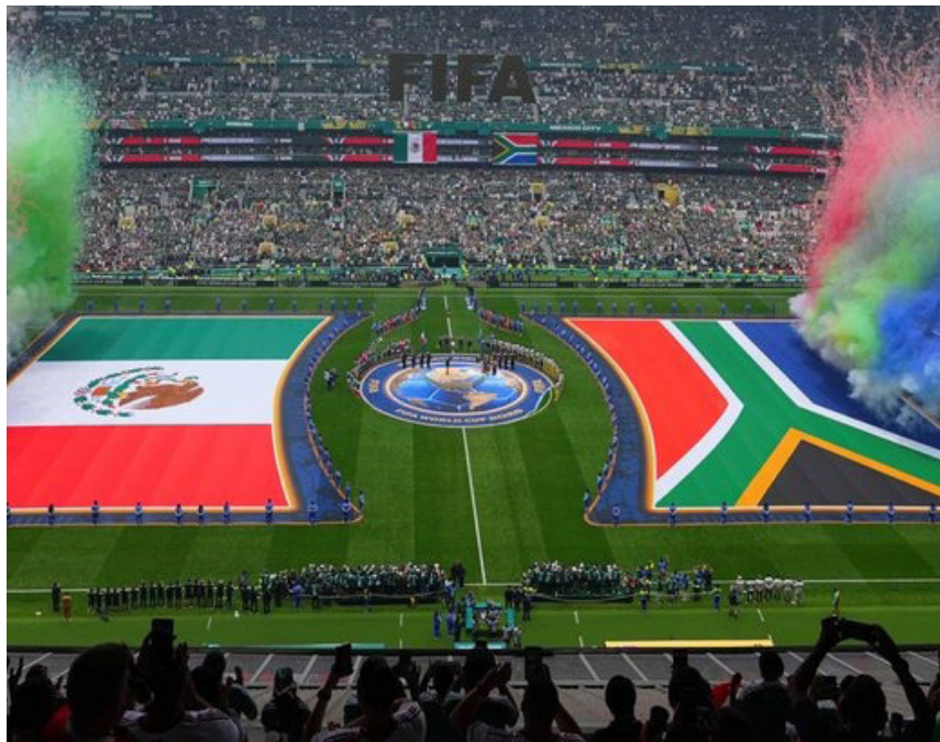
AFORO. El Estadio albergó a más de 80 mil personas.

La mañana comenzó con un Estadio Azteca repleto, envuelto en la emoción de volver a albergar una inauguración mundialista. Y no falló. La Copa del Mundo 2026 comenzó así con una deuda histórica saldada.